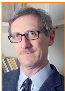
Partner e Responsabile Formazione Aziende di SLO

Le porte della casa di reclusione di Opera si sono aperte alle aziende. L'obiettivo? Capire come si lavora in un ambiente pieno di difficoltà e (solo) all'apparenza poco motivante